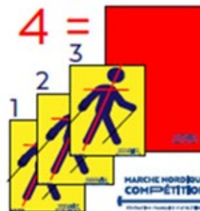
MARCHE NORDIQUE COMPÉTITION