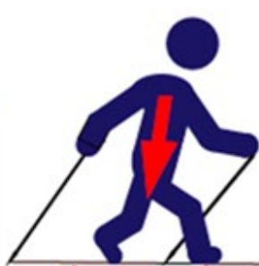
Abaissement du centre de gravité