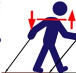
Oscillation des épaules