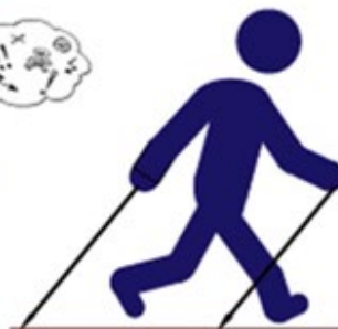
Pas de course